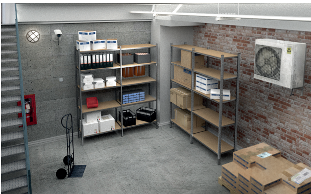
ARCHIVES DOSSIERS SUSPENDUS

Plaque «ISOREL» en option à poser sur la tablette à claire-voie.