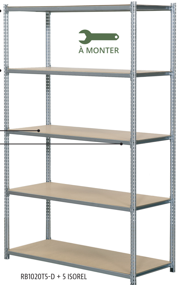
RB1020T5-D + 5 ISOREL